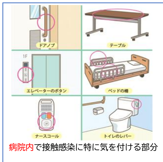
病院内で接触感染に特に気を付ける部分