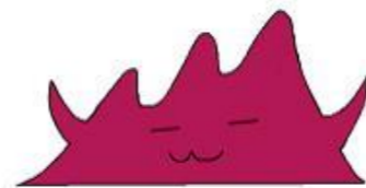
本校のマスコットキャラクター「あかのん」

「あかのん」とは、平成25年度に校内で開催されたゆるキャラグランプリで第1位を獲得したゆるキャラです。群馬中央病院内教室（当時は「群馬中央総合病院分教室」）に在籍していた中学部2年の生徒が考案しました。その後、赤城特別支援学校のマスコットとして、スポレク大会はじめ全校で知られるようになりました。