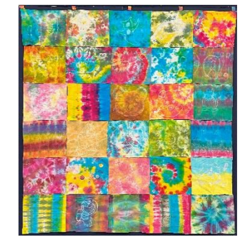
ハートフルアート展作品