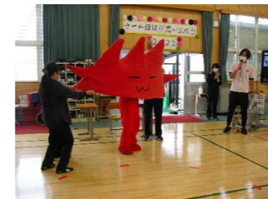
スポーツレクリエーション大会