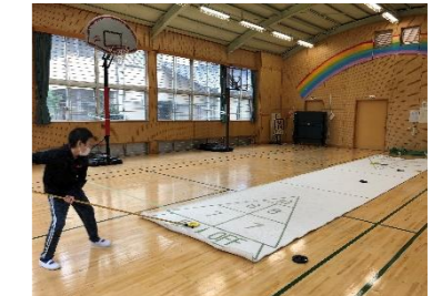
体育の授業 (シャフルボード)