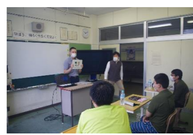
A L T 授業