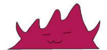
本校のマスコットキャラクター「あかのん」