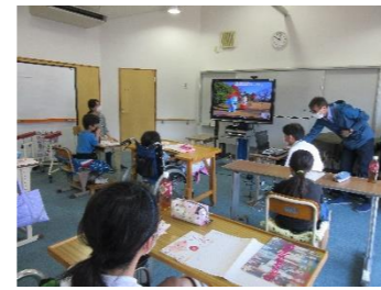
オンライン校外施設見学

入学及び転入学を希望する場合、医師の診断をもとに教育相談を行っています。 ● 医師の指示により長期間生活規制を必要とし、家庭又は入院中の病院から通学できること。 ● 群馬大学医学部附属病院に入院していて、ベッドまたは*通学での学習が可能であること。 ※通学は、病気療養中の身体及び生活上の安全性を確保する観点から許可制とし、医師の判断や通学の練習が必要となります。 なお、転入学については、在籍している高等学校と共通理解をしながら進めていきます。また、群馬大学医学部附属病院以外に入院していて学習指導を希望する場合等、不明な点は、ご相談ください。